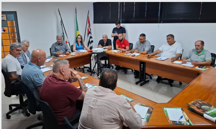
Antigo Benefício Assiduidade, de R$ 300, foi substituído pela Cesta Básica 2, de R$ 315

• Sem faltas injustificadas no mês: recebe R$ 315,00;