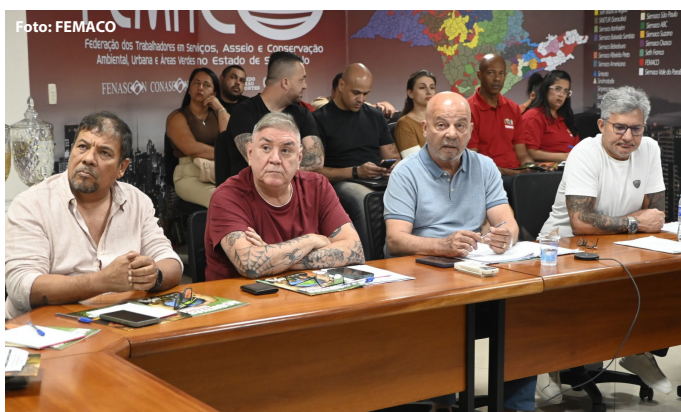
Reunião da campanha salarial 2026 conduzida pela FEMACO