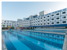
PRAIA GRANDE 1